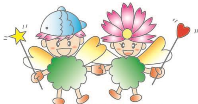
東かがわ市 健康づくりマスコット げんきくん えがおちゃん