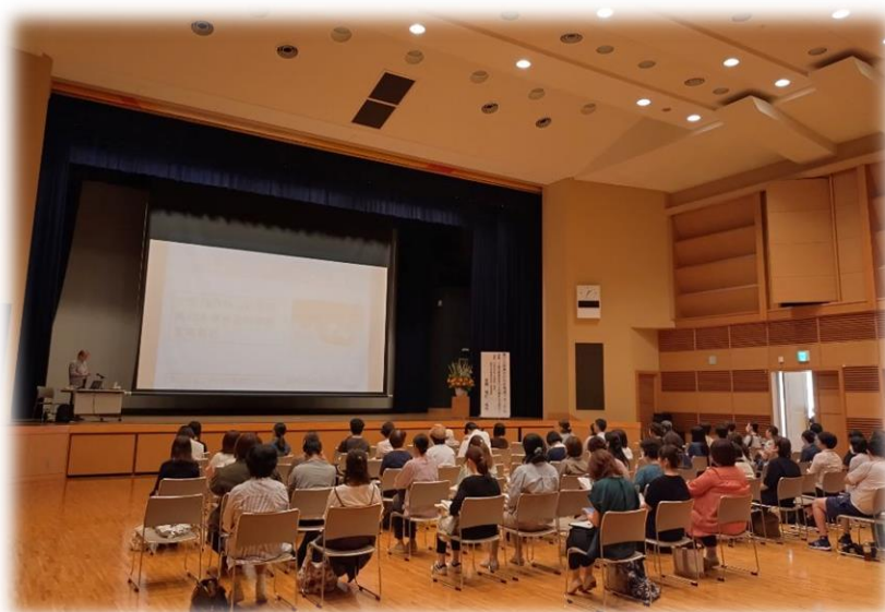
東かがわ市発達フォーラム開催 (令和6年6月30日)

※お手数ですが、令和6年6月26日(水)までに FAX・郵送・お電話・Web フォームいずれかにてお申込みください。