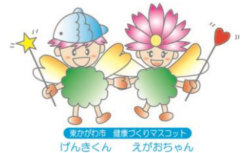
東かがわ市 健康づくりマスコット げんきくん えがおちゃん