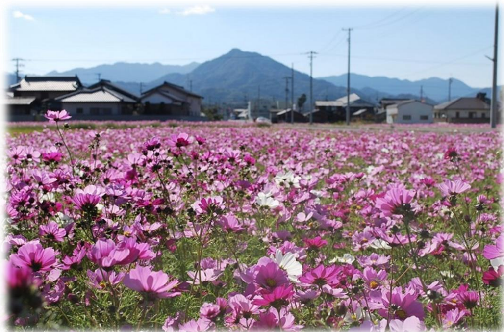
コスモス（東かがわ市花）と虎丸山